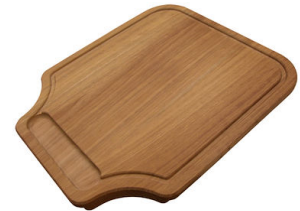
Planche de découpe en bois Iroko 8647 000